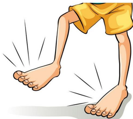
ТОП - ТОП