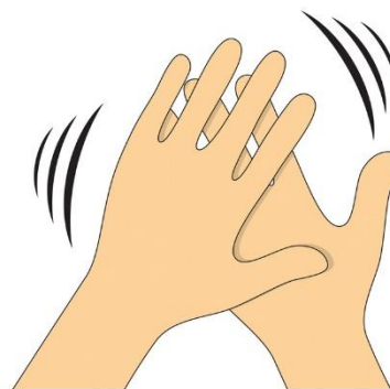
ХЛОП - ХЛОП